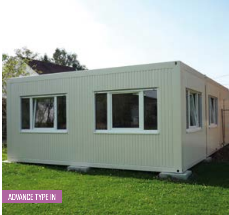
ADVANCE TYPE IN