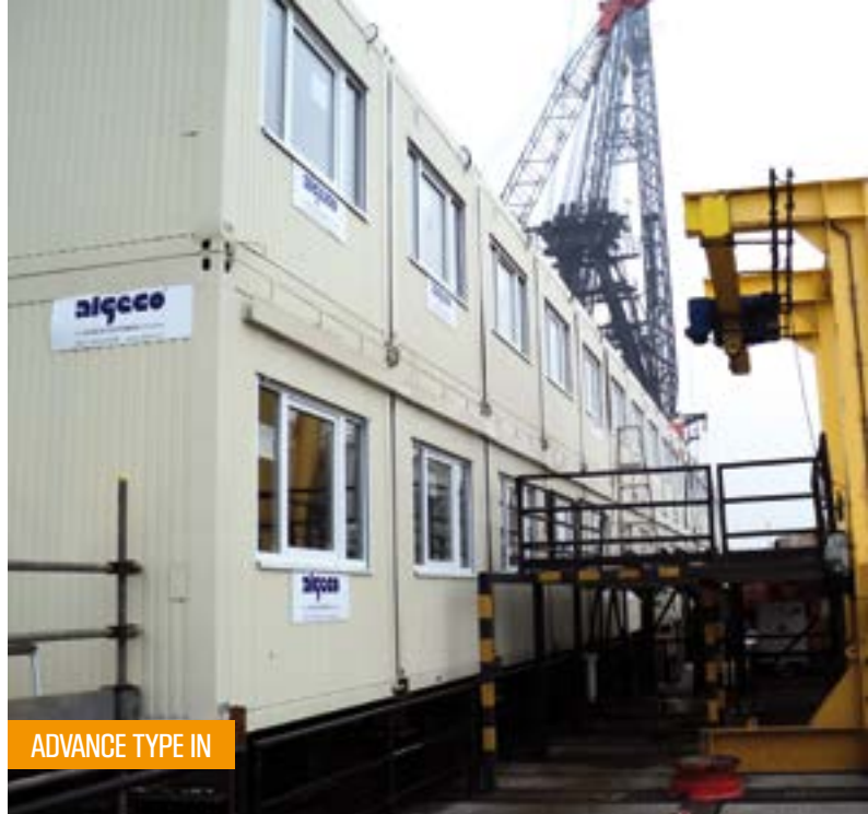
ADVANCE TYPE IN

Progress staat voor modulaire bouw in een nieuw tijdperk. Eentje waarin tijdelijke ruimtes niet alleen functioneel zijn, maar esthetisch en van hoge kwaliteit. Geschikt voor semi-permanente huur en koop.